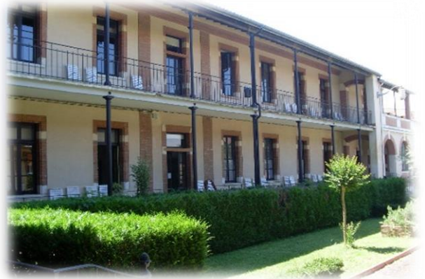
EHPAD site de Lombez