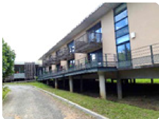
EHPAD de Samatan