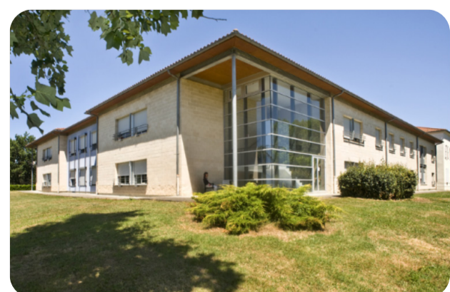
USLD Jardins d'Automne - La Ribère