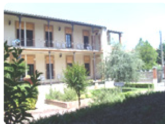
EHPAD de Lombez