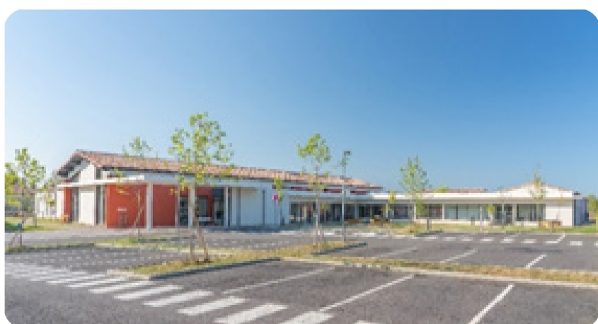
Site Saint Hippolyte

15 lits Médecine 15 lits de SSR 30 lits Unité de Soins Longue Durée 157 places en Hébergement Capacité de 6 personnes pour l'Accueil de jour 30 places pour le service de Soins Infirmiers à Domicile