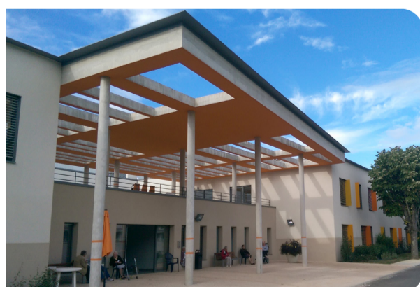
EHPAD Robert Barguisseau - La Ribère

550 lits et places dont 70 en USLD et 130 en EHPAD 85 232 journées d'hospitalisation MCO 19 412 journées d'hospitalisation SSR 65 191 passages externes 22 347 passages aux urgences 900 naissances