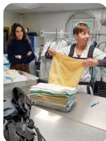
Manutention sollicitant les épaules