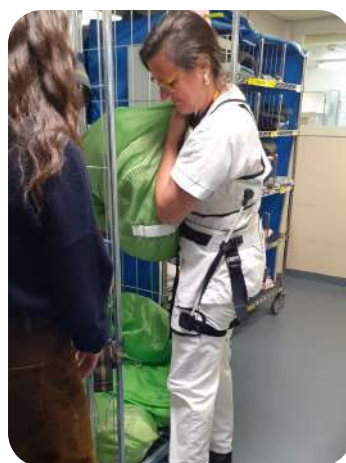
Port de charges lourdes

"Très facile à utiliser et adapté à tous".